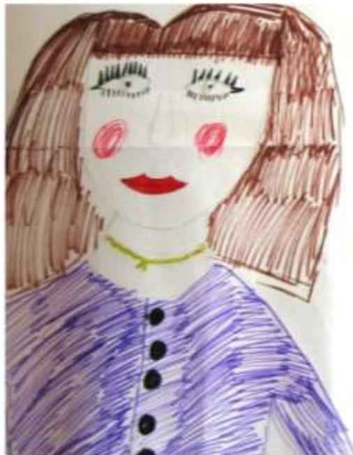
Рисунок Якимовой Полины, 3В класс

Я расскажу вам про маму, сестру и бабушку.