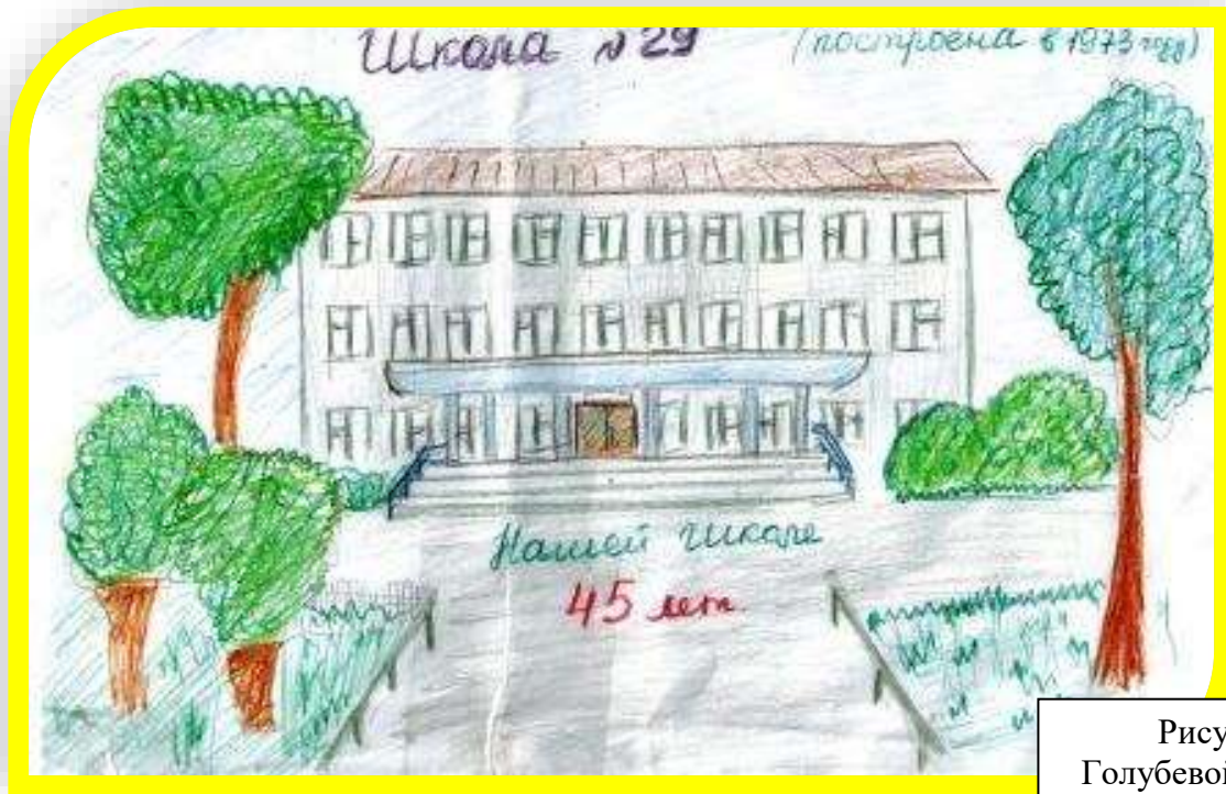
Рисунок Голубевой Софии, 2В класс

30 ноября у нашей школы замечательная дата! Ей исполняется 45 лет. В подарок любимому месту, где мы проводим большую часть своего времени, учащиеся нашей школы написали сочинения и стихотворения.