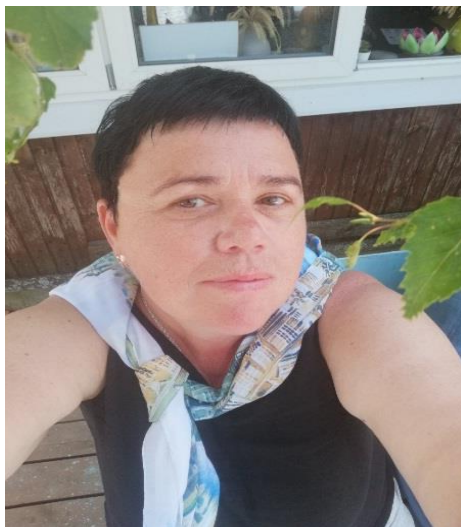
Один день на огороде